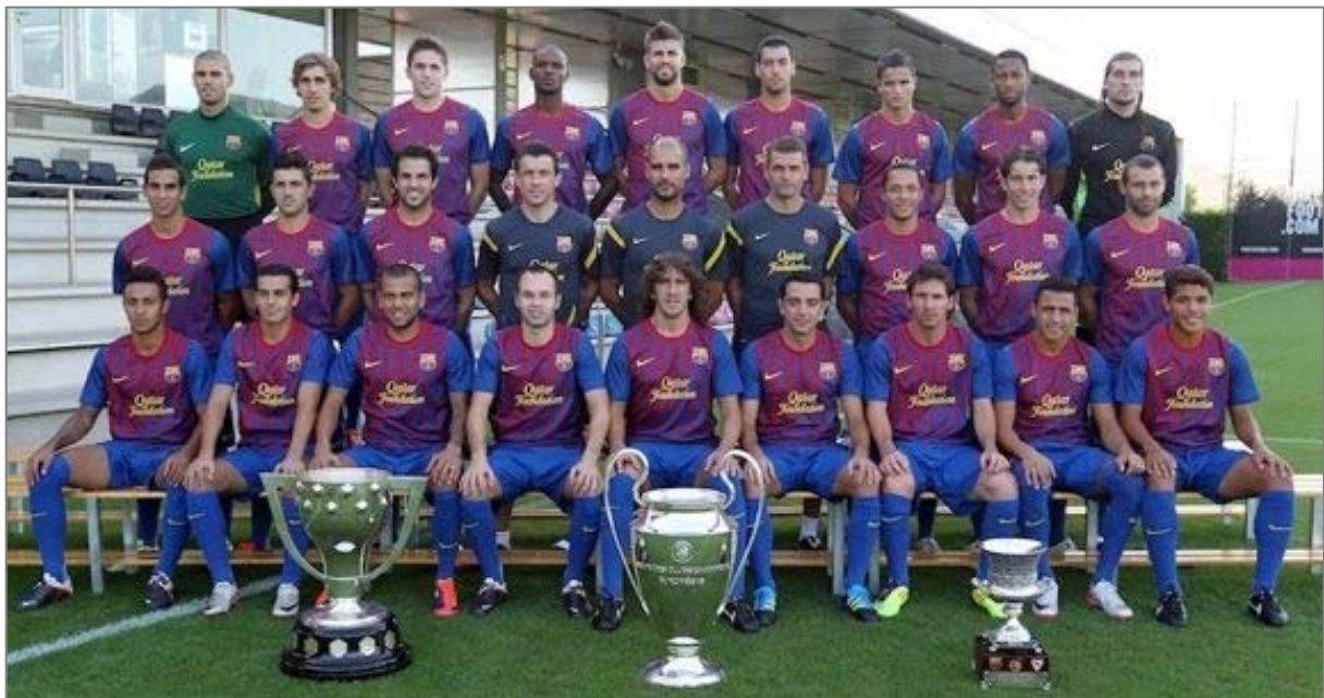
De selectie van seizoen 2011-2012

Ook grote buitenlandse spelers als Maradona, Ronaldo en Ronaldinho hebben naam gemaakt in Barcelona. Na het vertrek van zijn grote vriend en voorbeeld Ronaldinho in 2008, gaat de meeste aandacht binnen de huidige selectie uit naar Lionel Messi. De kleine tovenaars is, door zijn beslissende acties, erg belangrijk binnen het elftal, dat om hem heen gebouwd is. Aanvoerder van het huidige team is Carles Puyol, iets dat de supporters goed moet doen aangezien hij een echte Catalaan is.