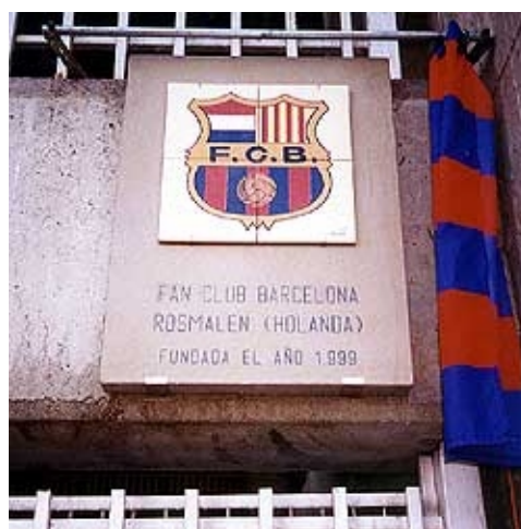
Het embleem (placa) van de Fan Club Barcelona dat aan één van de zijanten van het stadion hangt.

Uit onderzoek is gebleken dat de Club wereldwijd meer dan 50 miljoen aanhangers heeft. Voor de fanatiekste supporters is het mogelijk om lid te worden van FC Barcelona. Deze supporters worden socis genoemd. Barça heeft meer dan 170.000 socis. Ook heeft FC Barcelona heel veel penyes (fanclubs), ongeveer 1.500. De Fan Club Barcelona is er één van en staat officieel geregistreerd als penya número 1323. Verderop in dit opstelpakket meer over de Fan Club Barcelona.