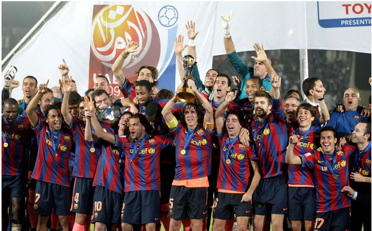
Het sterrenteam met de Wereldbeker voor clubs